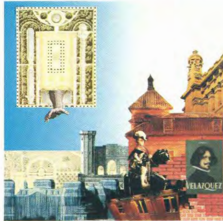
Los collages que ilustran esta monografía son obra de Juan Carlos Equillor