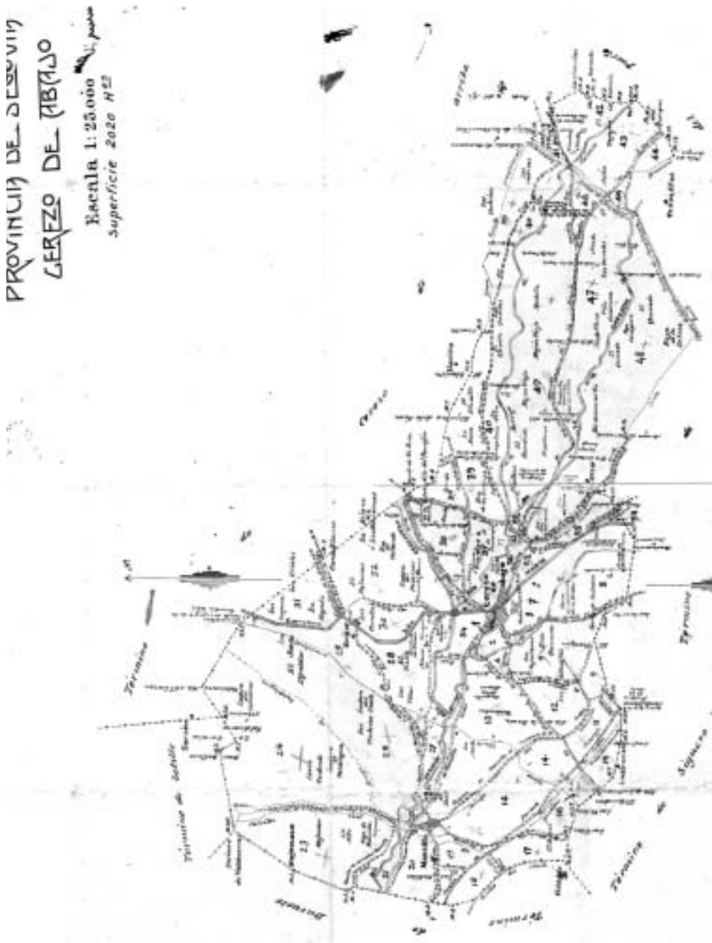
Planimetría a escala 1:25.000 (pañoleta) del término municipal de Cerezo de Abajo con indicación de los polígonos del Avance Catastral de 1954 (Gerencia Territorial de Catastro de Segovia). Se aprecian los microzootopónimos «Ladera del Colmenar», «Valdezorras», «Pradera de la Mula» y «Cañada Real Segoviana».