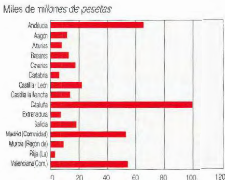
Gráfico 1. Impuesto Sobre Bienes Inmuebles Urbanos. Año 1993. Cuota íntegra por Comunidades Autónomas