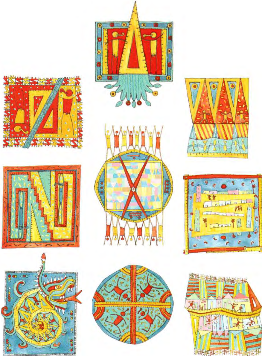
Las ilustraciones de esta Monografía son de María Alcobre